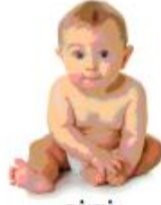
தர்மம் (CIVIL LAW)