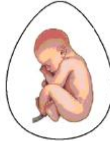
பிரமாணம் (PRIME LAW)