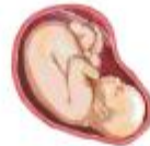
கர்மம் (CRIME LAW)